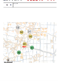
堀金小学校3年 めざとウォークラリー