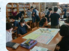
豊科北中地域探求学習の様子→

「ふるさと探求安曇野」とは、失われつつある安曇野の歴史文化景観遺産の存在や成り立ち等を様々な主体等との協働で子供たちに伝えていくしくみづくりを進める取り組みです。学習指導要領でも「探求型の学び」が重視されてきていることも踏まえ、次世代が市内のお宝の存在を現場で知り、学びそして伝えていく展開を生み出すことを目指しています。