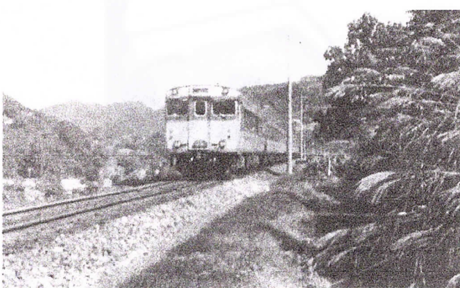
旧線を走るキハ58系急行列車