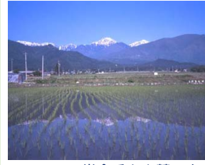
常念岳と山麓の水田

烏川谷の出口一帯は、山からの水と森からの恵みを享受できる場所ですが、扇頂部で礫も多く水温も低く地形も複雑なため、安定した稲作には工夫が必要な土地でした。長い年月をかけて先人たちが編み出してきた利水の工夫・苦勞の痕跡や山からの恵みも活かした文化、技術などが生まれ、常念岳を背景に全国にも誇れる里山環境が保たれています。