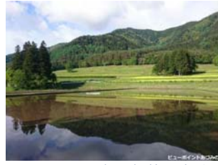
山裾の棚状の地形