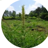
オオルリシジミと食草クララ