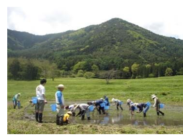
国営公園内での田植え体験