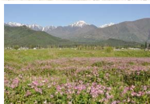
常念岳とれんげ畑