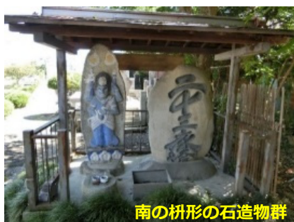
南の枡形の石造物群