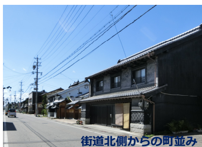
街道北側からの町並み

※ 中央日本塩の道地域連携整備計画調査文化調査報告書 別冊 歴史的町並み・集落等の分布調査編（2001年）