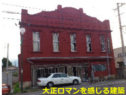
大正ロマンを感じる建築