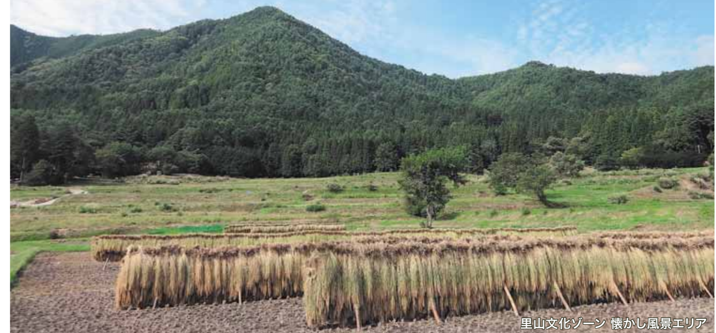
里山文化ゾーン 懐かし風景エリア